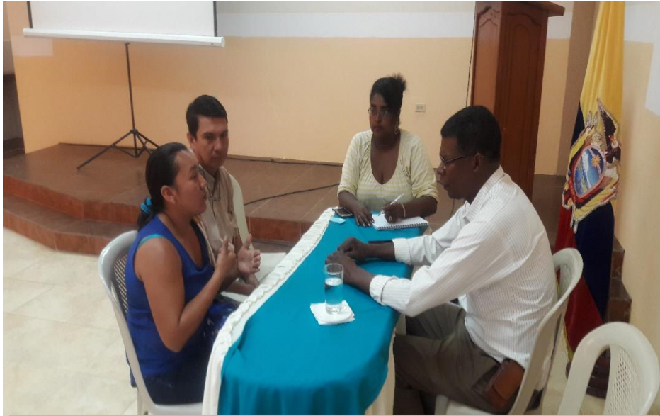
RCTO. LA T