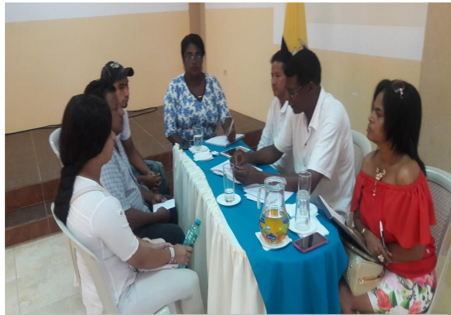
RCTO. LAS 40 ILUMINACIÓN CANCHA