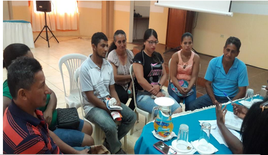
SECTOR SANTA ISABEL VIALIDAD