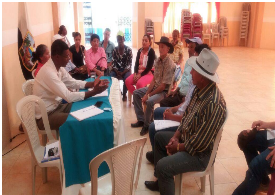
RCTO. UNIÓN MANABITA