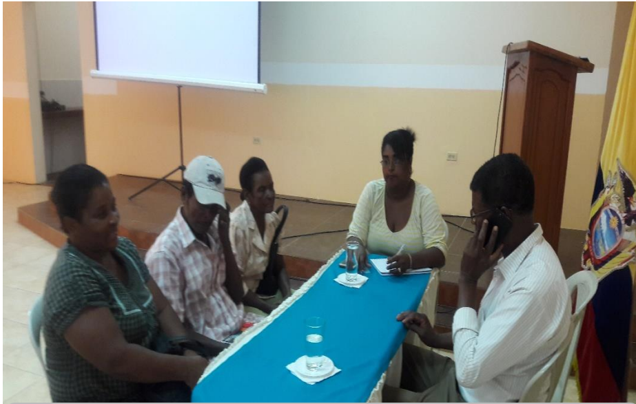
RCTO. PALMA REAL