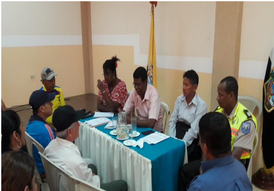
RCTO. ZONA 20 VIALIDAD Y SEGURIDAD CIUDADANA