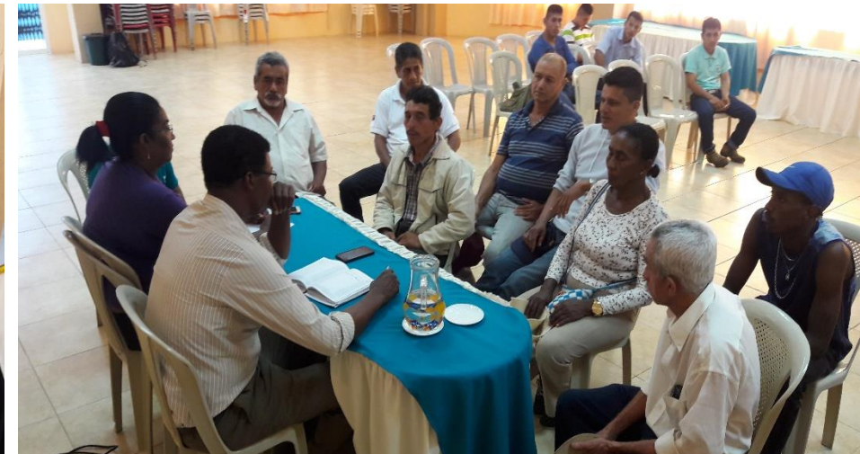
RCTO. NUEVA VIDA