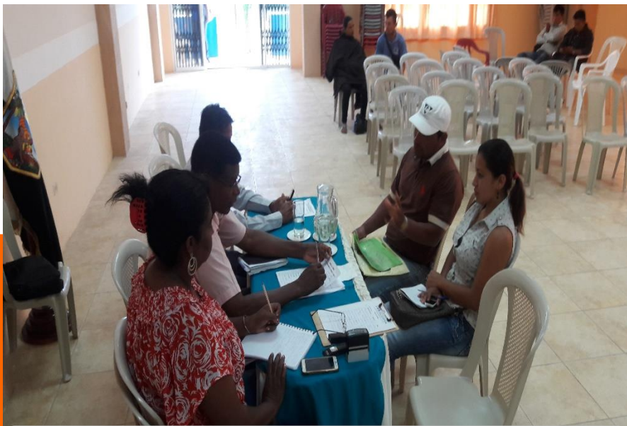
WILSON MOREIRA SECTOR RAMAL EL LAGRE VIALIDAD