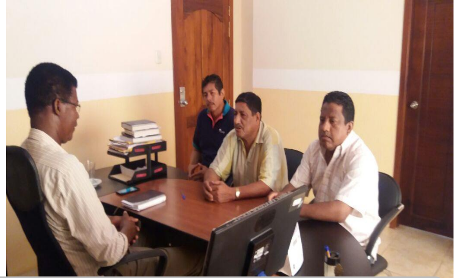
TRANSPORTISTAS QUE REALIZAN EL ROCORRIDO DE LOS ESTUDIANTES UNIDAD DEL MILENIO MALIMPIA