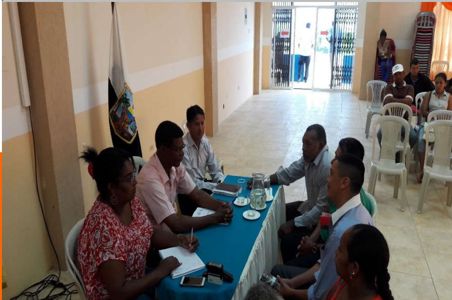
RCTO. ARTONAL ELECTRIFICACIÓN RURAL