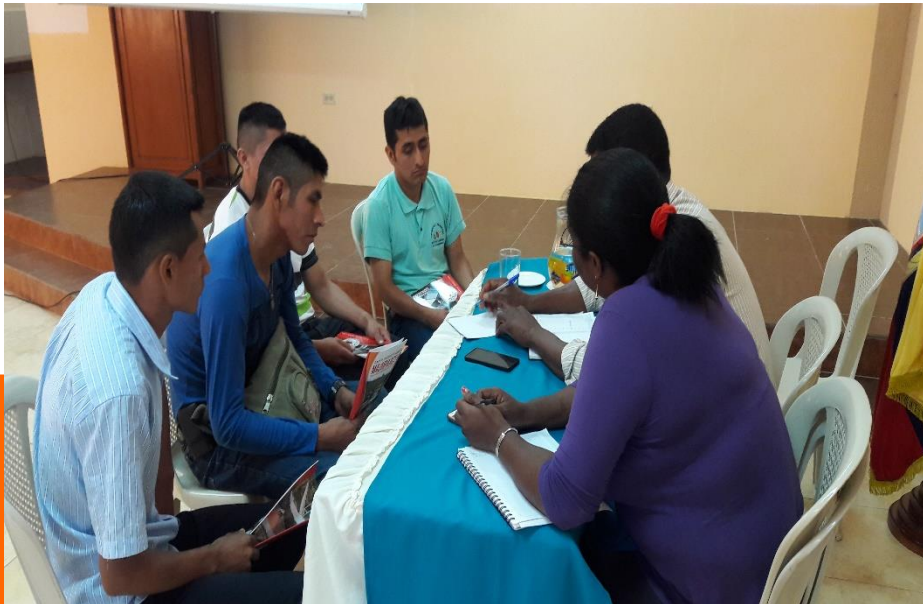
RCTO. VOLUNTAD DE DIOS