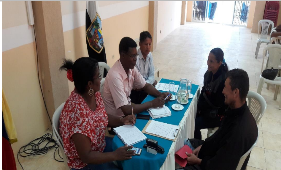
RCTO. 3 DE SEPTIEMBRE UNIFORMES DEPORTIVOS