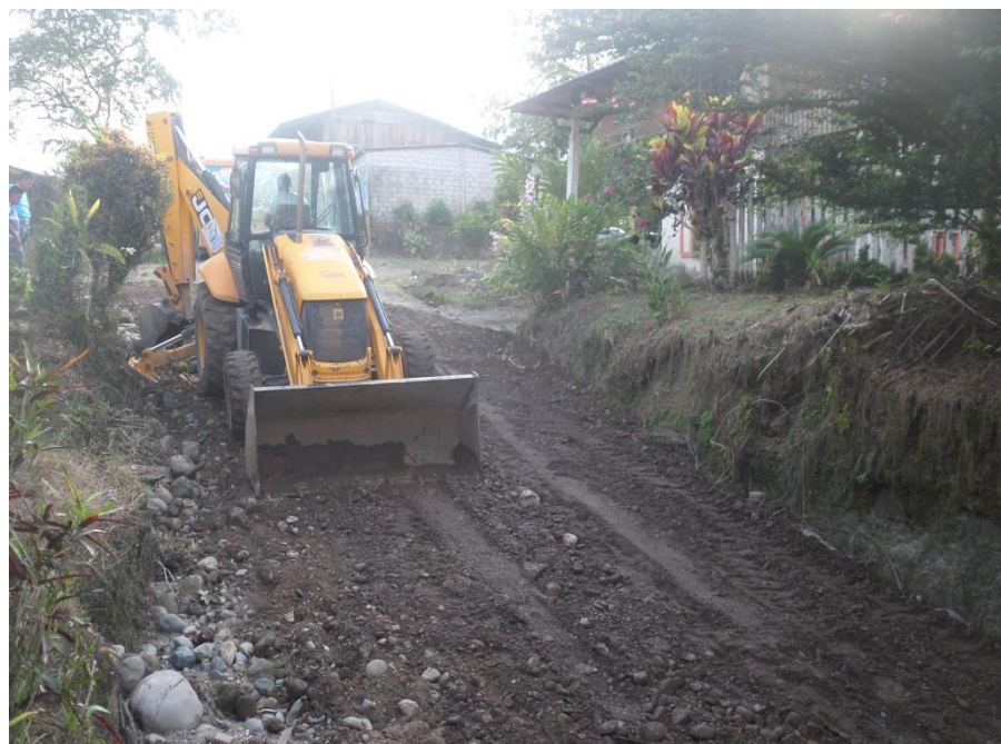
Minado del material pétreo .....