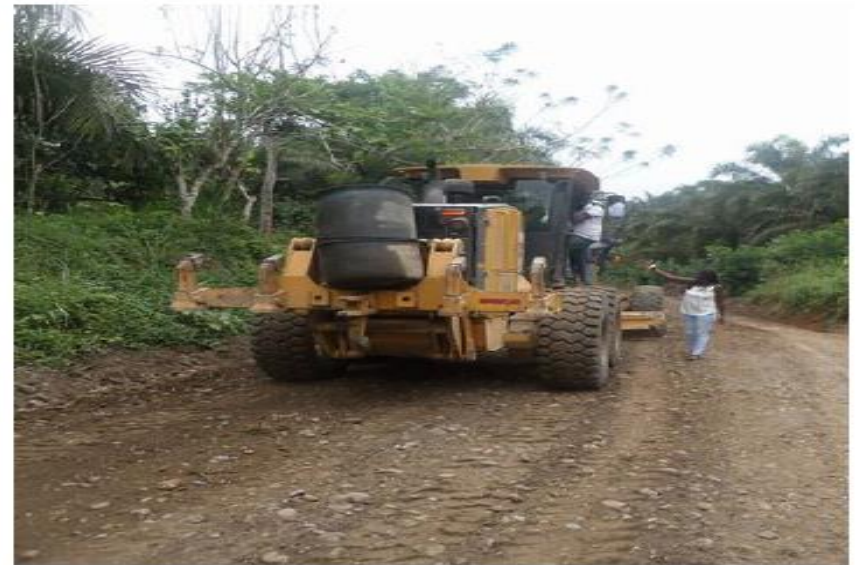
Arenales - Malimpia