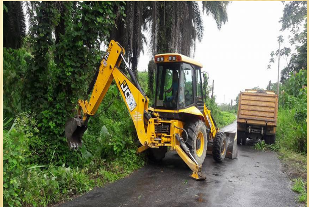
COCO - MALIMPIA