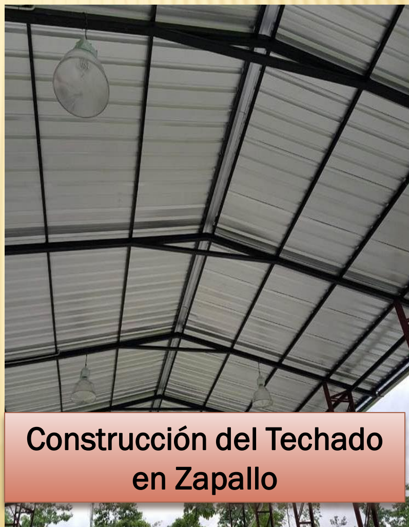
Construcción del Techado en Zapallo