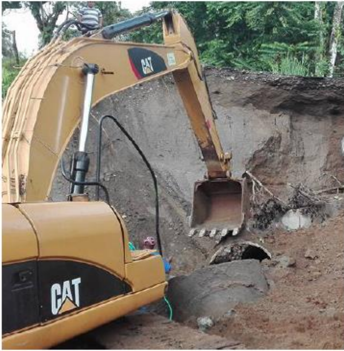
Vía Prto. Pupa - 5 de Agosto