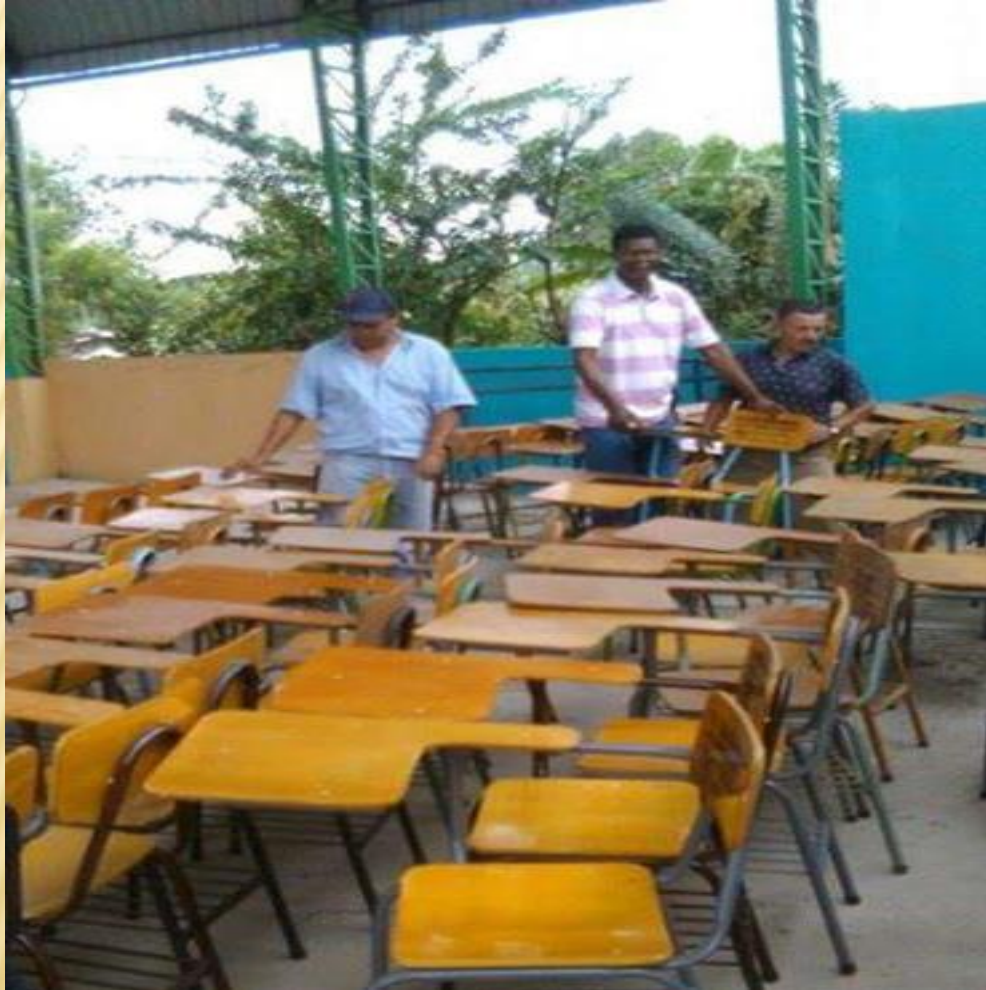
ENTREGA DE PUPITRAS A DIFERENTES UNIDADES EDUCATIVAS DE LA PARROQUIA