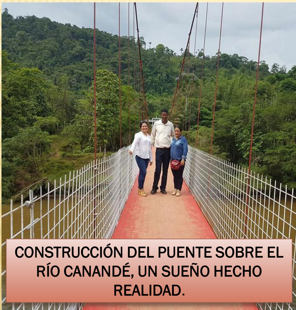
CONSTRUCCIÓN DEL PUENTE SOBRE EL RÍO CANANDÉ, UN SUEÑO HECHO REALIDAD.