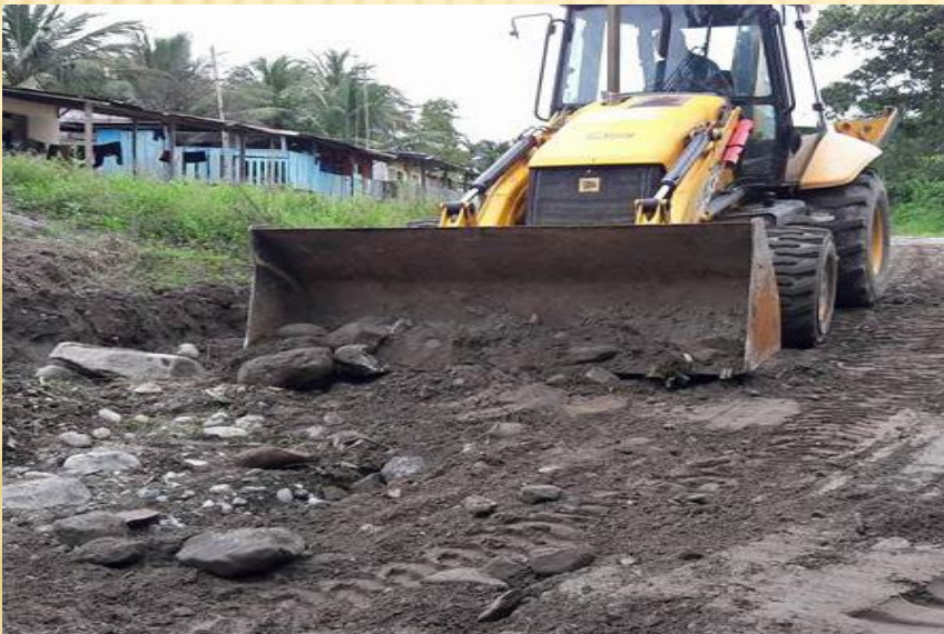
NARANJAL DE LOS CHACHIS