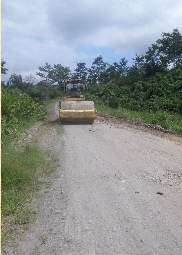
PUERTO CUPA LA GABARRA