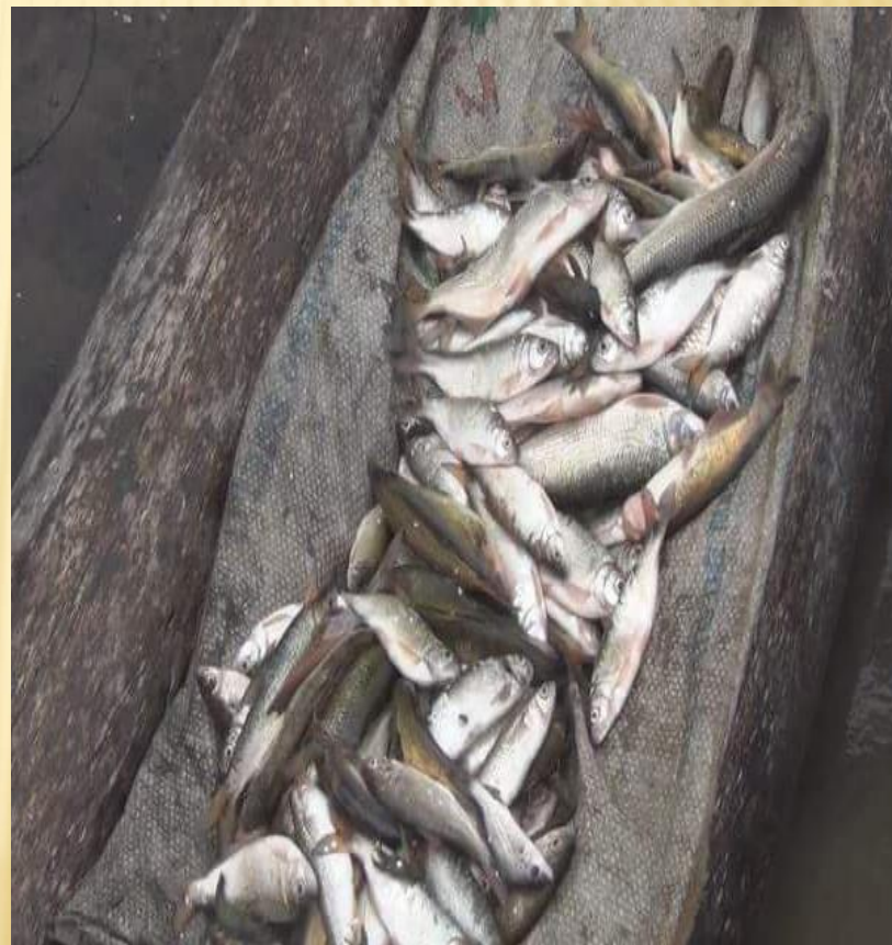
CONTAMINACIÓN DEL RIO