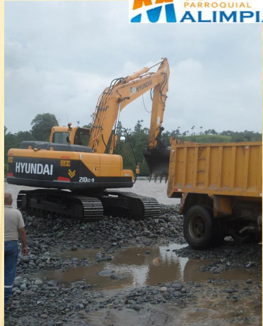
VALLE ESMERALDEÑO- UNIÓN LOJANA