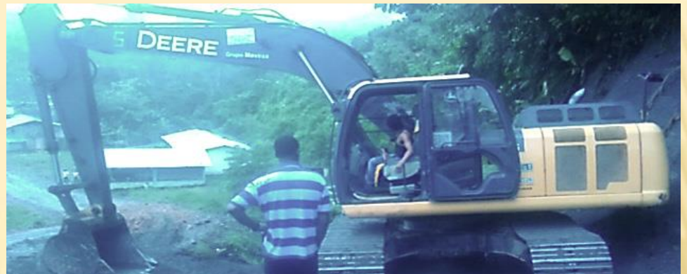
RECINTO AGUA CLARA