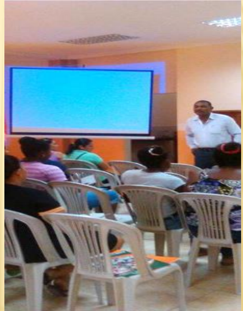
TALLER DE LIDERAZGO