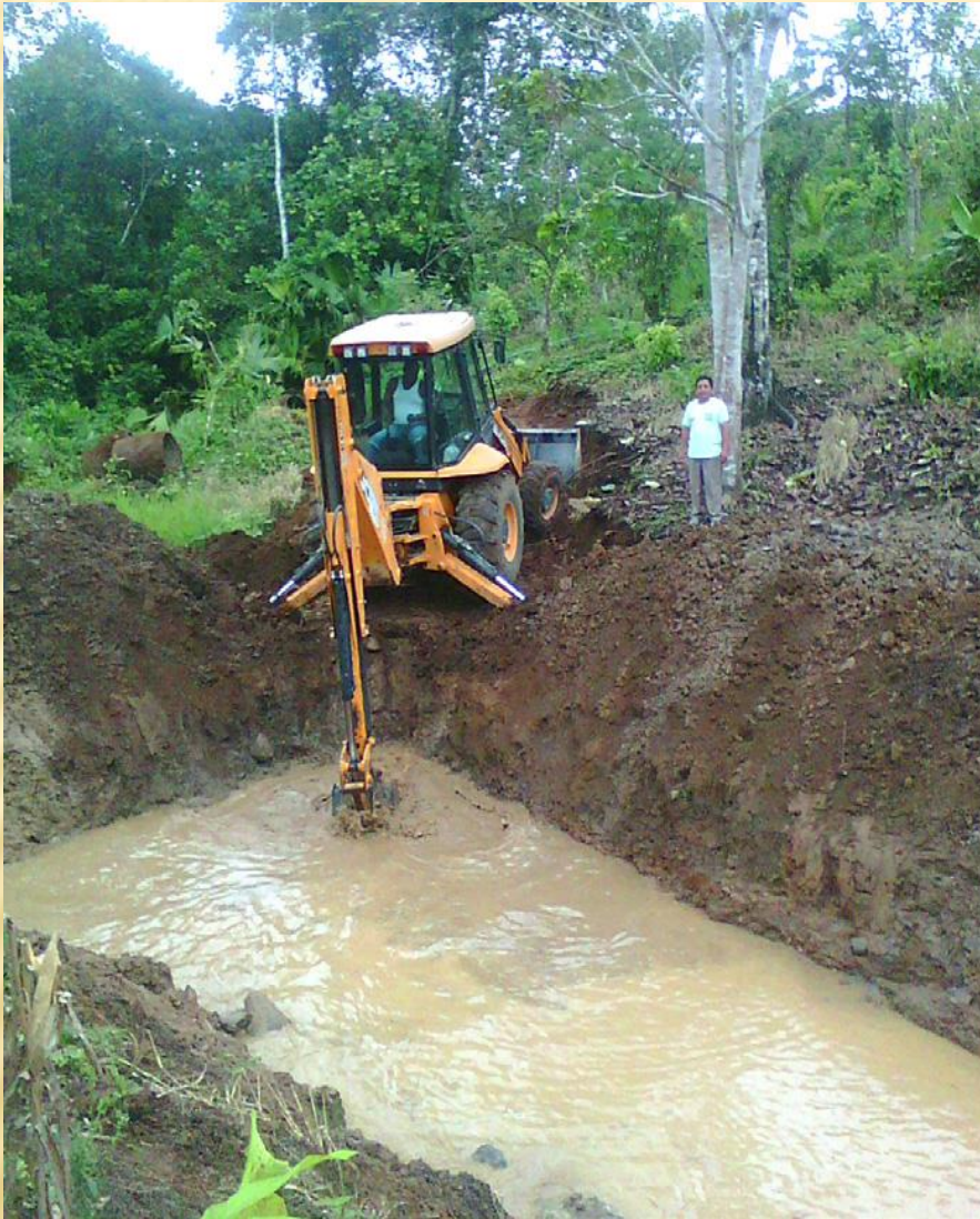
EXCAVACIÓN EN SAN ANTONIO