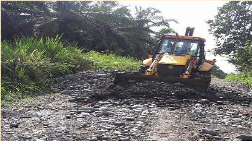
RECINTO SAN ANTONIO