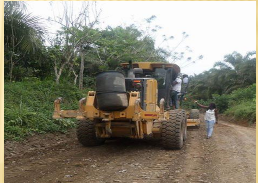
RECINTO ARENALES - MALIMPIA